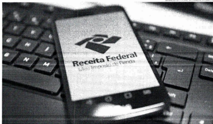
Limites para dedução dos gastos com educação foram questionados pelo Conselho Federal da Ordem dos Advogados do Brasil (OAB)

"O direito à educação, reconhecido constitucionalmente, não assegura um patamar determinado de despesas como parcelas dedutíveis da base de cálculo do imposto sobre a renda", escreveu Fux no voto seguido pela maioria. Os limites foram questionados pelo Conselho Federal da Ordem dos Advogados do Brasil (OAB), que alegou a violação de diversas garantias da Constituição, entre as quais o direito à educação, a dignidade da pessoa humana e