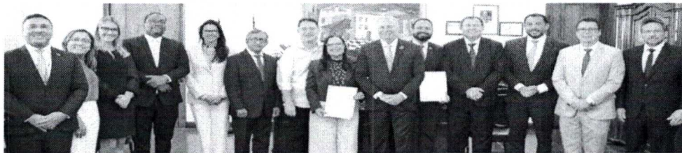
PARTICIPARAM DA SOLENIIDADE MAGISTRADOS, SERVIDORES E FAMILIARES