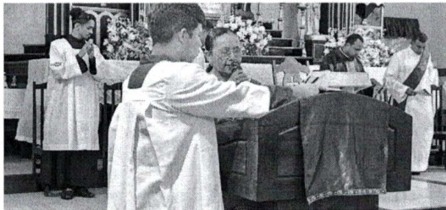
DEVOÇÃO A SÃO JOSÉ, CONSIDERADO PADROEIRO DOS TRABALHADORES E DAS FAMÍLIAS

A devoção a São José, considerado padroeiro dos trabalhadores e das famílias, tem raízes profundas na cultura popular maranhense. Em São José de Ribamar, essa relação se intensifica ao longo de dias de programação religiosa que antecedem a data principal, com destaque para as tradicionais novenas realizadas no Santuário. As celebrações reúnem comunidades inteiras em momentos de oração, cânticos e reflexão, reforçando o sentimento