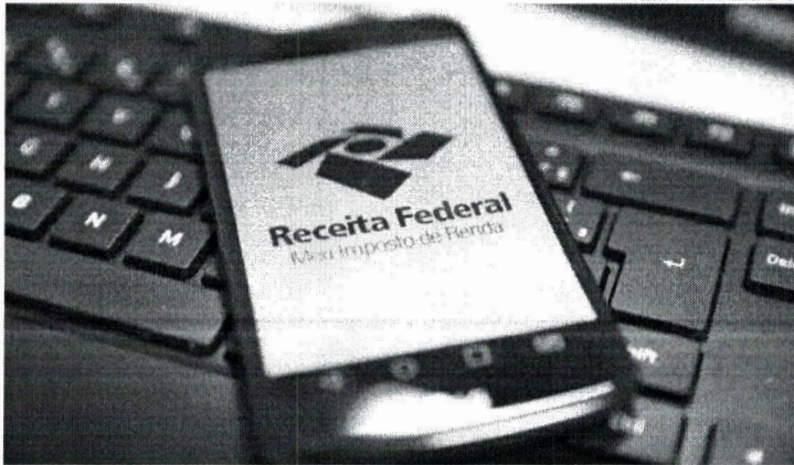
Limites para dedução dos gastos com educação foram questionados pelo Conselho Federal da Ordem dos Advogados do Brasil (OAB)

"O direito à educação, reconhecido constitucionalmente, não assegura um patamar determinado de despesas com parcelas dedutíveis da base de cálculo do imposto sobre a renda", escreveu Fux no voto seguido pela maioria. Os limites foram questionados pelo Conselho Federal da Ordem dos Advogados do Brasil (OAB), que alegou a violação de diversas garantias da Constituição, entre as quais o direito à educação, a dignidade da pessoa humana e