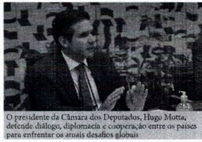
O presidente da Câmara dos Deputados, Hugo Motta, defende diálogo, diplomacia e cooperação entre os países para enfrentar os atuais desafios globais

Durante a abertura do 11º Fórum Parlamentar do BRICS, o presidente da Câmara dos Deputados, Hugo Motta, defendeu que o grupo priorize o diálogo, a diplomacia e a cooperação entre os países para enfrentar os atuais desafios globais, como tensões geopolíticas e o enfraquecimento do multilateralismo. Ele reforçou a necessidade de reformas em organismos internacionais, como o Conselho de Segurança da ONU, para torná-los mais representativos e adequados à realidade do século 21. Motta propôs mudanças na Organização Mundial do Comércio (OMC), com foco em garantir regras mais justas para os países em desenvolvimento, especialmente no setor agrícola. Defendeu o fortalecimento do comércio entre os países do BRICS, a eliminação de barreiras não tarifárias, o uso de moedas locais em transações e a criação de sistemas tributários mais justos. Entre as prioridades legislativas citadas estão o investimento em saúde pública, o incentivo