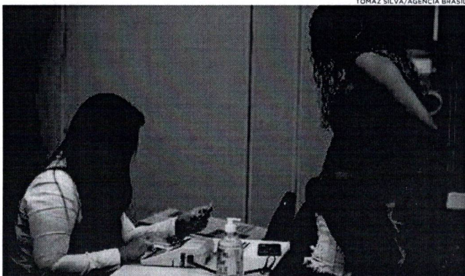
Brasil possui 1.836.081 eleitores na faixa etária de 16 e 17 anos

Já na outra ponta do eleitorado, 15,2 milhões de eleitores acima dos 70 anos estão aptos a votar neste ano, 9,76% do eleitorado total. O número é 23% maior que em 2020, quando eram 12,3 milhões. Somando-se aos jovens, totalizam 20,5 milhões