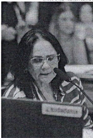
Para Damares Alves, punir com mais rigor crimes cometidos durante "saídas" é melhor do que acabar com o benefício

A Comissão de Segurança Pública (CSP) aprovou, nessa terça-feira (2), um projeto de lei que torna mais duras as penas para os crimes cometidos durante saída temporária, liberdade condicional, prisão domiciliar ou em meio a fugas da prisão. O projeto, da senadora Damares Alves (Republicanos-DF), recebeu voto favorável do relator, o senador Esperidião Amin (PP-SC), e agora segue para análise da Comissão de Constituição e Justiça (CCJ). A votação foi presidida pelo senador Sérgio Petecão (PSD-AC). O PL 476/2023 altera o artigo 61 do Código Penal (Decreto-Lei 2.848, de 1940), incluindo essas situações na lista das circunstâncias agravantes dos crimes. Isso significa que, ao calcular a pena a ser aplicada a um condenado, o juiz deverá impor uma punição maior se o crime tiver sido cometido durante o cumprimento de um benefício como saída temporária ou liberdade condicional, ou enquanto o criminoso estava fugindo do estabelecimento prisional. Na justificativa do projeto, Damares afirmou que punir mais rigorosamente os crimes cometidos durante saídas temporárias é um caminho melhor do que acabar completamente com esse tipo de benefício. Para ela, é preciso respeitar a política pública de ressocialização; no entanto, a sociedade não pode ficar vulnerável e por isso exige rigor na