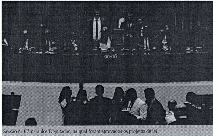
Sessão da Câmara dos Deputados, na qual foram aprovados os projetos de lei

O Plenário da Câmara também aprovou o Projeto de Lei 2600/23 que tipifica o crime de violação de bagagem para tráfico de drogas. O texto iguala ao crime de tráfico de drogas a prática de violar bagagem para usar no tráfico de drogas, prática feita sem o consentimento do dono da mala. O projeto e uma resposta ao caso de duas brasileiras que ficaram um mês presas na Alemanha depois que tiveram as malas trocadas por outras com drogas.