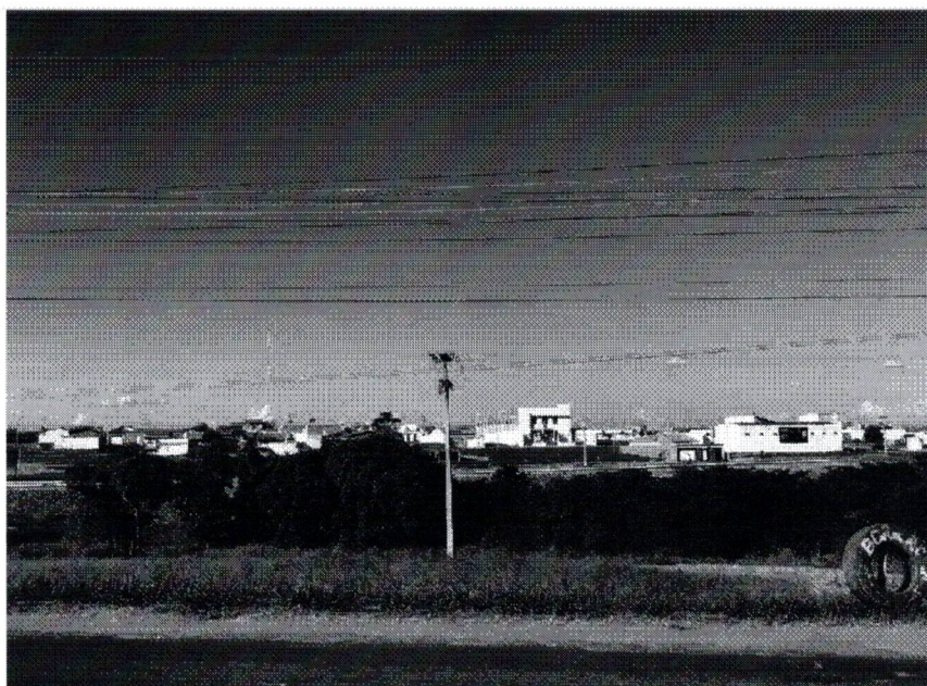
FRENTE DO TERRENO Data da última atualização: 05/08/2021