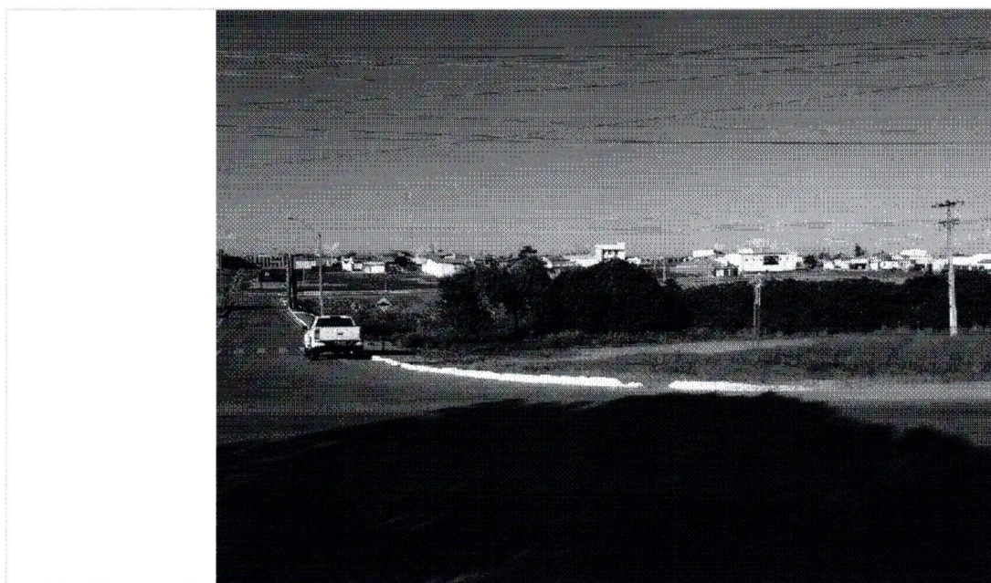
LADO DIREITO Data da última atualização: 05/08/2021