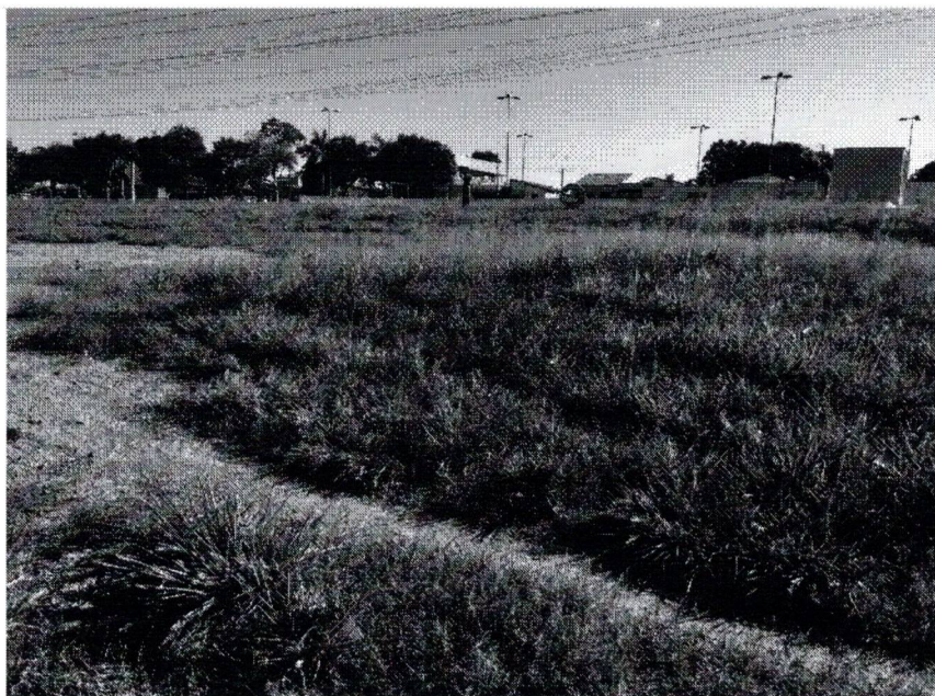
FUNDO DO TERRENO Data da última atualização: 05/08/2021